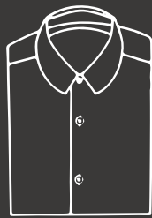
Cierre francés (sin tapeta)